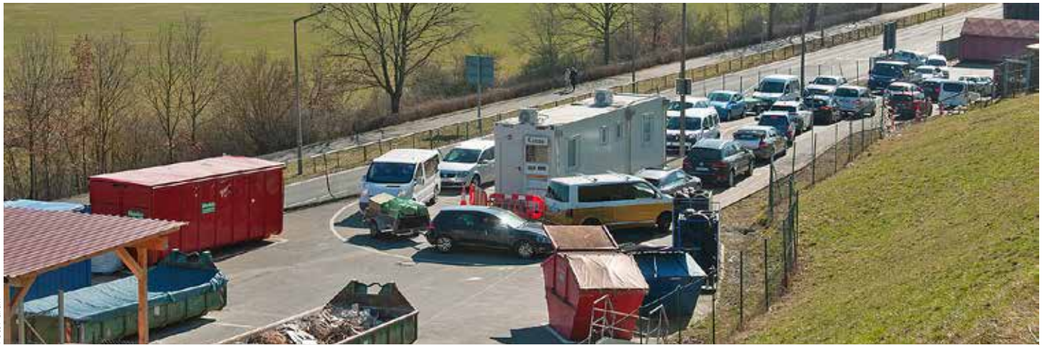
Lange Rückstaus und Verkehrsprobleme an den Wertstoffhöfen sind derzeit an der Tagesordnung.

Für viele Bürgerinnen und Bürger sind das sonnige Wetter und die steigenden Temperaturen ein geeigneter Anlass, den Haushalt oder den Garten auf Vordermann zu bringen und ordentlich auszumisten. Für die städtischen Entsorgungsanlagen bedeutet das während der Corona-Pandemie eine enorme Herausforderung. Dies betrifft sämtliche Wertstoffhöfe in der Umgebung, auch weit über die Fürther Stadtgrenze hinaus.